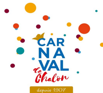
Voici le carnaval de Chalon-sur-Saône